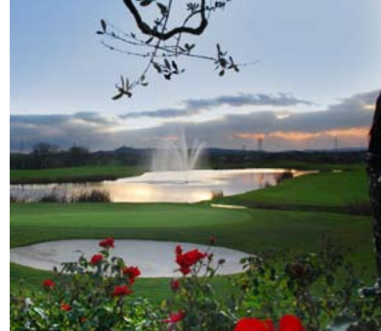
Uno scorcio spettacolare del Chervò San Vigilio Golf Resort.

Per facilitare la comprensione, gli interventi dei relatori stranieri saranno tradotti in consecutiva.