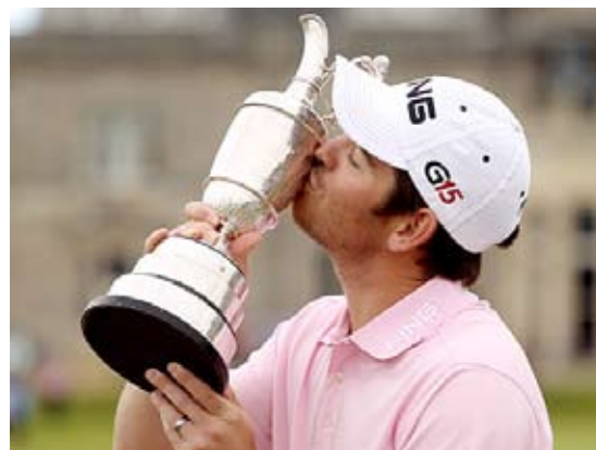
Il sudafricano Louis Oosthuizen vincitore del British Open 2010.

manuale di concentrazione sbagliata nel modo e nel tempo. Louis, giocatore dallo swing purissimo, non aveva mai in precedenza esplorato gli aspetti mentali del gioco. Aperto al dialogo, disponibile ad imparare e riconoscendo