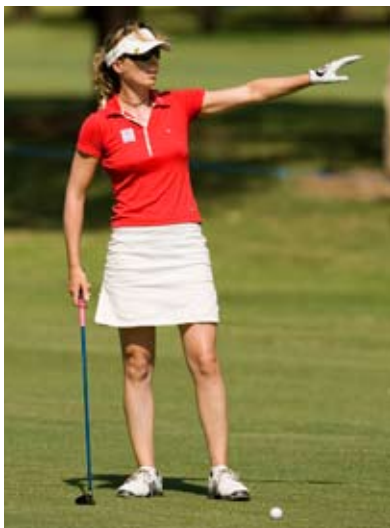
PGA EUROPEAN TOUR