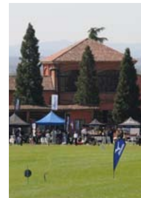
A Margara, dal 18 al 23 aprile, torna la Pgai Pro Week

Sempre lunedì 19, nelle sale del club, sono in calendario vari momenti di incontro, seminari