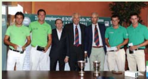
In alto, i vincitori; qui, la premiazione dei secondi parimerito